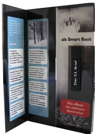
Smart Book Box

Neben der Promo-Aktion „All you can read“ hat sich der Perlen Verlag entschieden, dezent themenverwandte Werbebanner anderer Firmen zu platzieren und schafft sich so zusätzliche Einnahmequellen.